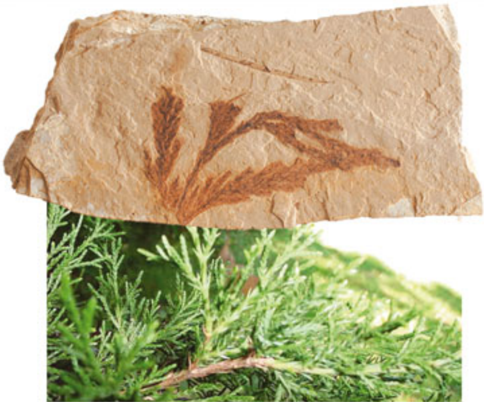
Yalancı Servi Yapağı Dönem: Senozoik zaman, Eosen dönemi Yaş: 50 milyon yıl Bölge: Cache Creek Oluşumu, Kanada

İğne yapraklı bitkilerden olan yalancı servi ağacının 50 milyon yıldır değişmediğini gösteren resimdeki fosil, evrimcilerin iddialarının doğru olmadığını söylemektedir. Doğa tarihi, birbirine çok benzeyen ve yakın türlere değil, birbirlerinden çok farklı ve aralarında büyük yapısal farklılıklar bulunan gruplara ayrılmıştır. Bu da canlıların evrimleşmediğinin bir anda var olduklarının bir kanıtıdır.