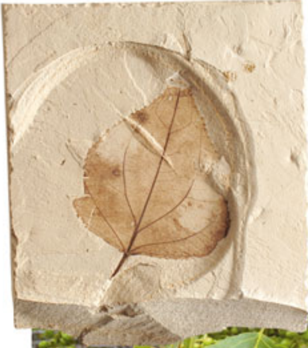
Kavak Yaprağı Dönem: Senozoik zaman, Eosen dönemi Yaş: 54 - 37 milyon yıl Bölge: Green River Oluşumu, Utah, ABD

Kavakların bir başka bitkiden türemediklerini, herhangi bir evrimsel ataya sahip olmadıklarını, hep kavak olarak var olduklarını gösteren bu fosil, bir Yaratılış delilidir. Günümüzdeki kavakların her yönüyle aynısı olan, yaklaşık 50 milyon yıl önce yaşamış kavaklar, evrimin hayal ürünü bir senaryodan ibaret olduğunu gözler önüne sermektedir.