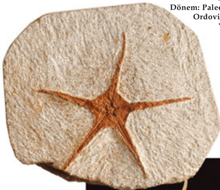
Deniz Yıldızı Dönem: Paleozoik zaman, Ordovisyen dönemi Yaş: 500 - 440 milyon yıl Bölge: Fas

Yaklaşık yarım milyar yıldır hiç değişmeden soylarını devam ettiren deniz yıldızları karşısında evrimciler çaresizlik içindedir. Çünkü söz konusu canlılar on milyon değil, yüz milyon değil, iki yüz milyon değil, yaklaşık beş yüz milyon yıldır aynıdırlar. Resimdeki 500 milyon yıllık deniz yıldızının da ispatladığı gibi, deniz yıldızları hep deniz yıldızı olarak var olmuşlardır.