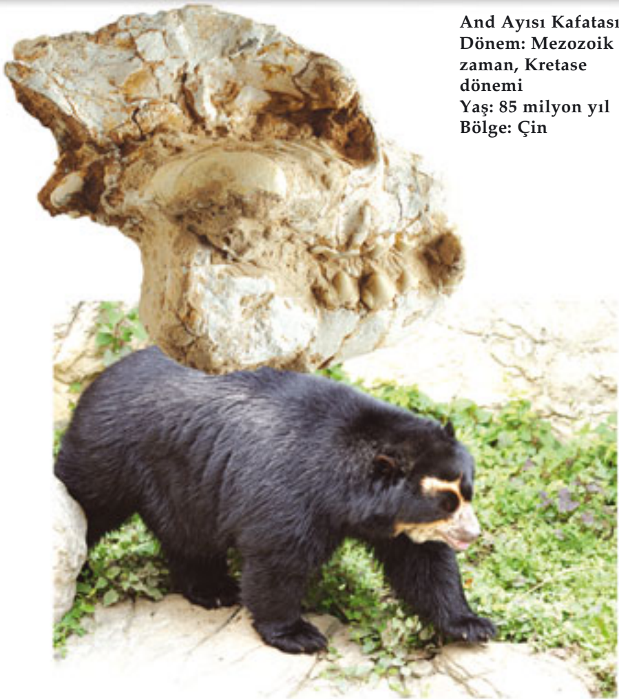
And Ayısı Kafatası Dönem: Mezozoik zaman, Kretase dönemi Yaş: 85 milyon yıl Bölge: Çin

Kafatası tüm detaylarıyla korunmuş olan bu And ayısı fosili, söz konusu canlıların tarihin her döneminde aynı olduklarını ortaya koymaktadır. 85 milyon yıl önce yaşamış bu canlının diş yapısı, göz çukurları, çene yapısı vs. And ayılarının on milyonlarca yıldır değişmediklerini, yani evrim geçirmediklerini söylemektedir.